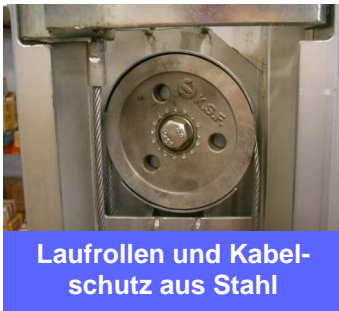
Laufrollen und Kabelschutz aus Stahl