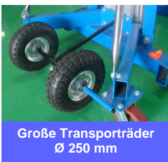
Große Transporträder Ø 250 mm