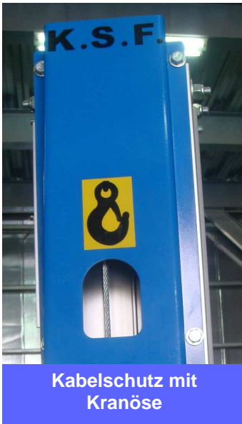
Kabelschutz mit Kranöse