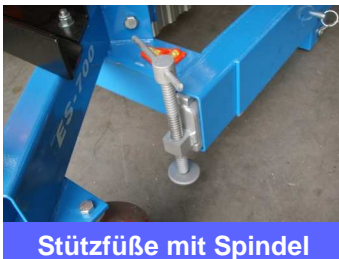
Stützfüße mit Spindel