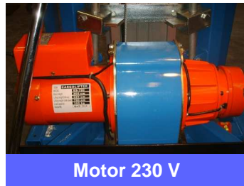
Motor 230 V