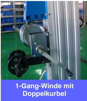
1-Gang-Winde mit Doppelkurbel